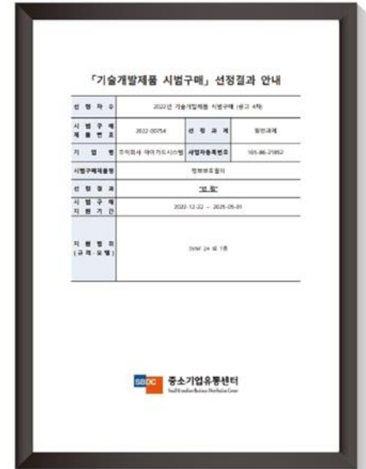
기술개발제품 시범구매 선정